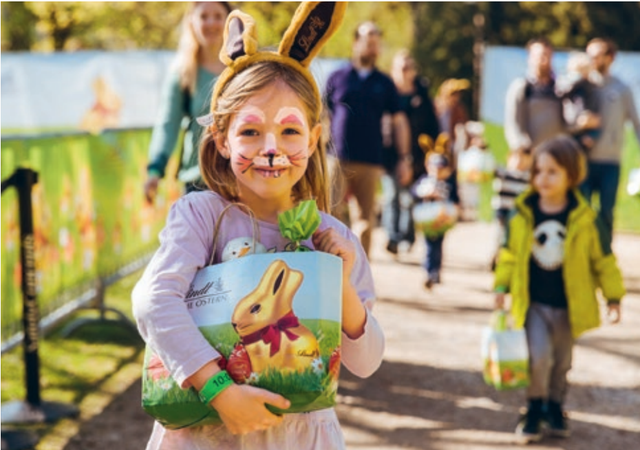
Die grösste Osterhasensuche Österreichs mit vielen spannenden Aktivitäten im Schlosspark Schönbrunn in Wien liess Kinderherzen höherschlagen.

Marktanteile dazu. Die erfolgreichen Marken Lindor und Excellence trugen überdurchschnittlich zur Umsatzentwicklung bei, und das Saisongeschäft entwickelte sich aufgrund erfolgreicher Werbekampagnen für den Lindt Goldhasen und den Lindt Teddy erfolgreich. 2017 behauptete der Goldhase erneut seine Nr. 1 Position unter den Hohlfiguren, und der Teddy wurde zur Kultfigur des Weihnachtsgeschäfts.