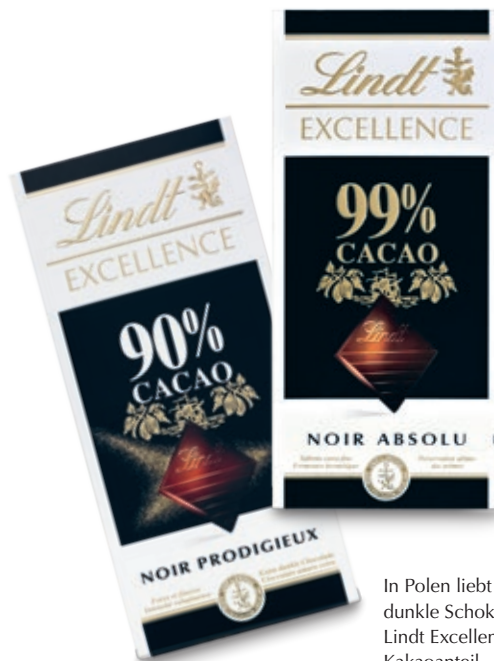
In Polen liebt man besonders dunkle Schokolade der Lindt Excellence mit hohem Kakaoanteil.

Lindt & Sprüngli (Russia) LLC erzielte aufgrund höherer Marktdurchdringung ein starkes zweistelliges Umsatzplus von +24,5%. Besonders die beiden Marken Excellence und Lindor unterstützten das erfreuliche Wachstum der Tochtergesellschaft in einem der am schnellsten wachsenden und grössten Schokolademärkte der Welt und gewannen erneut wichtige Marktanteile hinzu. Auch die Expansion der eigenen Shops wurde mit der Eröffnung des zweiten Lindt Shops in Moskau fortgesetzt.