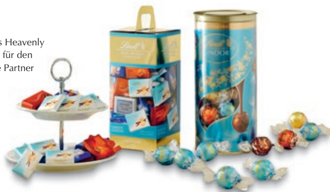
Exklusives Heavenly Sortiment für den Duty Free Partner Dufry.

Die weltweite Einführung der neuen Assortierten Napolitains Produkte, der Lindt Chocolate Trolleys, die mit einem aufsehenerregenden Display im Trolleyformat und Marketingaktionen an den Verkaufsstellen für Aufmerksamkeit sorgten, waren besonders erfolgreich. Auch die Limited Edition von Lindor Mango & Cream, die zusammen mit der beliebten Lindor Kugel Milch vermarktet wurde, erzielte neue Verkaufsrekorde. Im Berichtsjahr wurden ebenfalls zahlreiche neue Premium Shop-in-Shop-Auftritte in den Flughäfen, unter anderem in London, Paris, Prag, Singapur, Taipeh und Doha, realisiert. Das Jahr wurde Lindt & Sprüngli besonders versüsst durch die Verleihung des DFNI Branchenawards für die beste globale Travel Retail Produkteinführung der Lindt Swiss Masterpiece Pralinés sowie durch drei Nominierungen bei den Frontier Awards in Cannes.