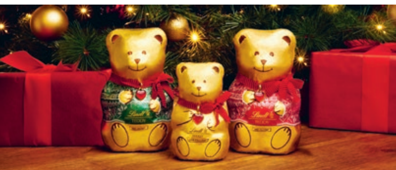
Die erfolgreiche Teddy Crew, die den englischen Markt im Sturm erobert hat.

Lindt lancierte zudem erfolgreiche Osterkampagnen für Familien. Die Osterhasensuche mit Produktsamplings in Kooperation mit sechs Royal Horticultural Gardens, in Premium Shoppingcentern und neu im Royal Palace Hampton Court waren sehr erfolgreich. In Irland konnte die Markenaufmerksamkeit und die Interaktion mit Konsumenten bei Aktionen zur Personalisierung von Goldhasen in Zusammenarbeit mit dem Charity-Partner Temple Street Children's Hospital erhöht werden. Der «Christmas Jumper Teddy» war wiederum ein grosser Verkaufsschlager und glänzte neu in klassischem Grün.