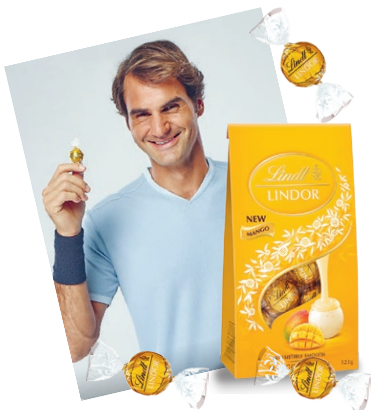
In Australien liebt man besonders die Mango & Cream Edition.

Lindt & Sprüngli (China) Ltd. hatte ein erfolgreiches Jahr mit einem zweistelligen Umsatzwachstum von +33,3%. Die Marken Lindor und Excellence haben sich durch Produktneuheiten und neue Rezepturen sehr positiv entwickelt. Lindor als hochwertiges Geschenk zum chinesischen Neujahr konnte die Markenbekanntheit ausbauen. Die Distribution wurde von