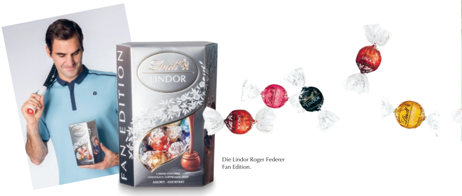
Die Lindor Roger Federer Fan Edition.

Die Lindt & Sprüngli Schweiz AG wird 2018 mehr als CHF 30 Mio. in den Ausbau und die Modernisierung des Lindt Swiss Cocoa Centers am Produktionsstandort Olten investieren. Die Expansion des Lindt Cocoa Centers in Olten gilt als Schlüsselprojekt für den Standort Schweiz und sichert nachhaltig die Versorgung der Produktionsstätten in Europa mit Kakaomasse.