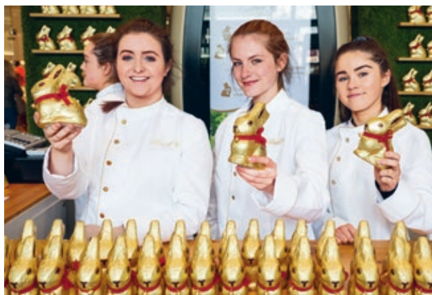
Lindt Osterhasen Personalisierung zugunsten des Temple Street Children's Hospital in Dublin.

Lindt lancierte zudem erfolgreiche Osterkampagnen für Familien. Die Osterhasensuche mit Produktsamplings in Kooperation mit sechs Royal Horticultural Gardens, in Premium Shoppingcentern und neu im Royal Palace Hampton Court waren sehr erfolgreich. In Irland konnte die Markenaufmerksamkeit und die Interaktion mit Konsumenten bei Aktionen zur Personalisierung von Goldhasen in Zusammenarbeit mit dem Charity-Partner Temple Street Children's Hospital erhöht werden. Der «Christmas Jumper Teddy» war wiederum ein grosser Verkaufsschlager und glänzte neu in klassischem Grün.