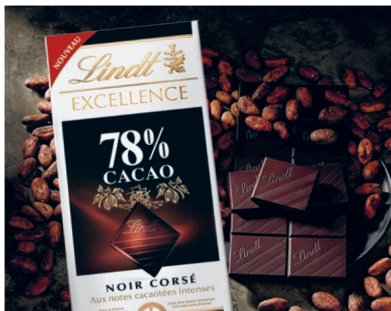
Neue Rezeptur der Lindt Excellence mit 78% Kakaoanteil.

Les Pyrénéens Pralinés mit einem neuen Kokosnussrezept. Der Verkauf wurde auf kleinere Ladenformate in umsatzstarken Grossstädten ausgeweitet, um Konsumenten auch in der Nähe zum Wohnort Zugang zu ihren Lieblingsprodukten von Lindt zu ermöglichen.