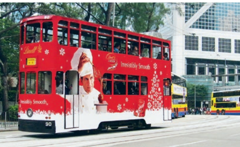
Marketingaktion in China: Die Lindt Tram sorgte für Aufsehen in Hongkong.

Schanghai und Peking auf weitere Grossstädte ausgeweitet. Die Präsenz eines Lindt Flagship Stores bei Tmall und JD führte zu einer überproportional positiven Entwicklung des E-Commerce-Vertriebskanals. Die starke Präsenz auf Hochzeitsmessen, um von der hohen Popularität von Premium-Schokolade als Hochzeitsgeschenk zu profitieren, erhöhte ebenfalls die Bekanntheit.