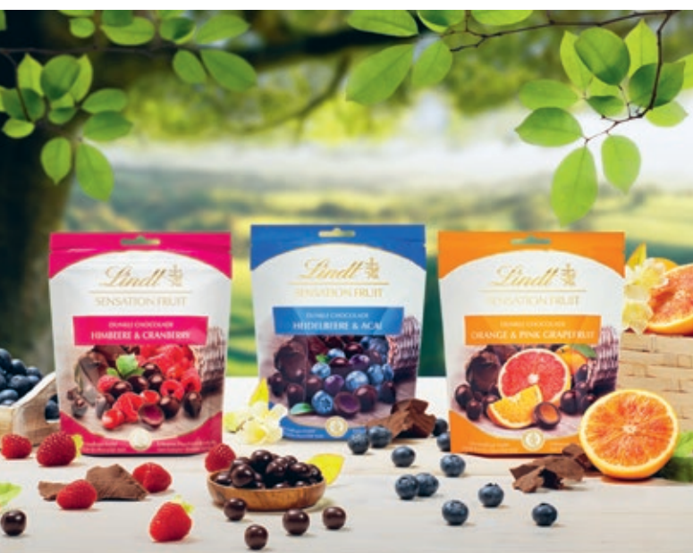
Lindt Sensation Fruits – eine der erfolgreichsten Produktinnovationen aus Frankreich.