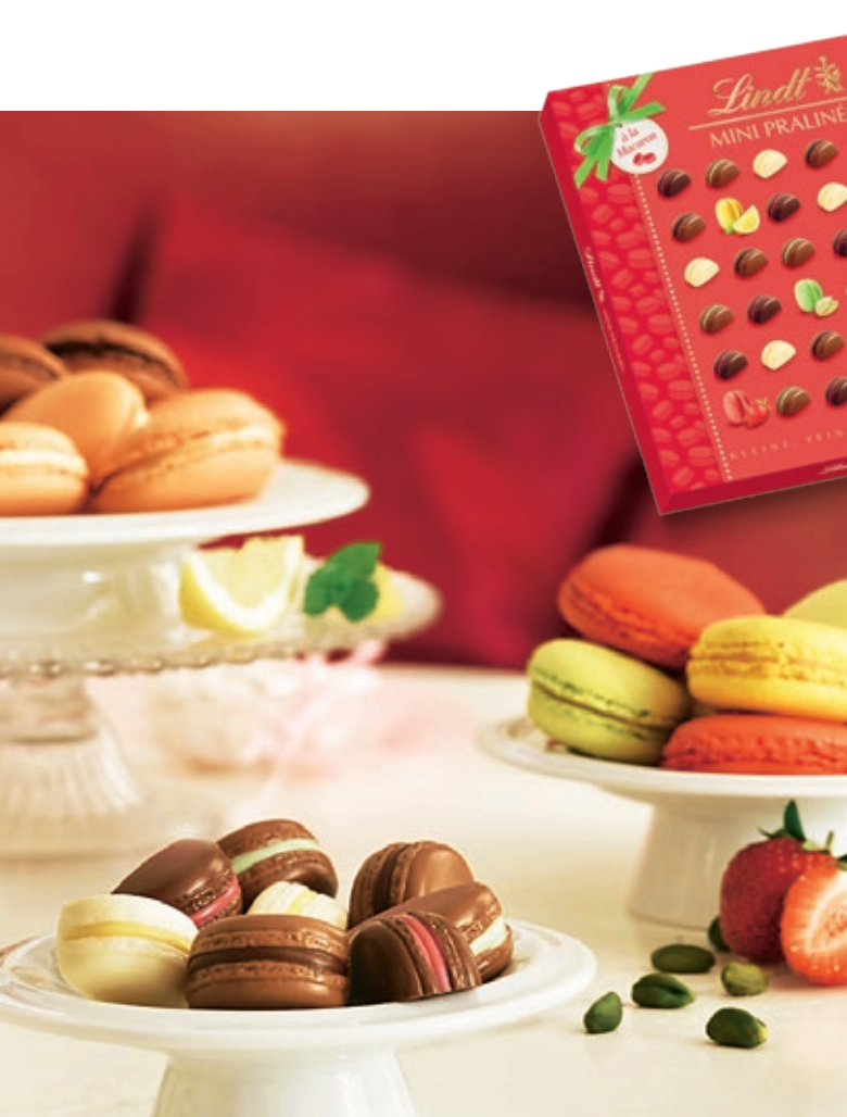
Mini Pralinés à la Macarons, eine köstliche Mischung aus Lindt Schokolade mit cremigen Füllungen und knusprigen Baiserstückchen.