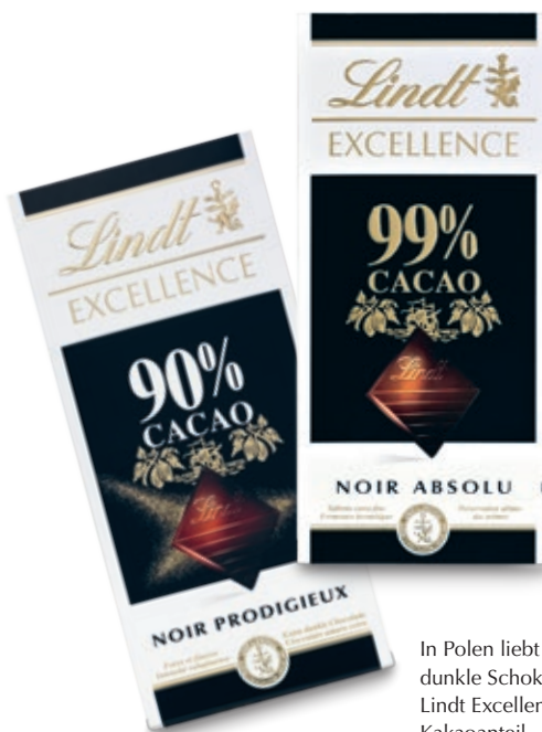
In Polen liebt man besonders dunkle Schokolade der Lindt Excellence mit hohem Kakaoanteil.

Lindt & Sprüngli (Russia) LLC erzielte aufgrund höherer Marktdurchdringung ein starkes zweistelliges Umsatzplus von +24,5%. Besonders die beiden Marken Excellence und Lindor unterstützten das erfreuliche Wachstum der Tochtergesellschaft in einem der am schnellsten wachsenden und grössten Schokolademärkte der Welt und gewannen erneut wichtige Marktanteile hinzu. Auch die Expansion der eigenen Shops wurde mit der Eröffnung des zweiten Lindt Shops in Moskau fortgesetzt.