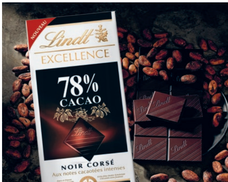
Neue Rezeptur der Lindt Excellence mit 78% Kakaoanteil.

Les Pyrénéens Pralinés mit einem neuen Kokosnussrezept. Der Verkauf wurde auf kleinere Ladenformate in umsatzstarken Grossstädten ausgeweitet, um Konsumenten auch in der Nähe zum Wohnort Zugang zu ihren Lieblingsprodukten von Lindt zu ermöglichen.