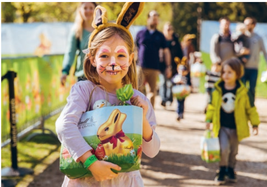
Die grösste Osterhasensuche Österreichs mit vielen spannenden Aktivitäten im Schlosspark Schönbrunn in Wien liess Kinderherzen höherschlagen.

Marktanteile dazu. Die erfolgreichen Marken Lindor und Excellence trugen überdurchschnittlich zur Umsatzentwicklung bei, und das Saisongeschäft entwickelte sich aufgrund erfolgreicher Werbekampagnen für den Lindt Goldhasen und den Lindt Teddy erfolgreich. 2017 behauptete der Goldhase erneut seine Nr. 1 Position unter den Hohlfiguren, und der Teddy wurde zur Kultfigur des Weihnachtsgeschäfts.